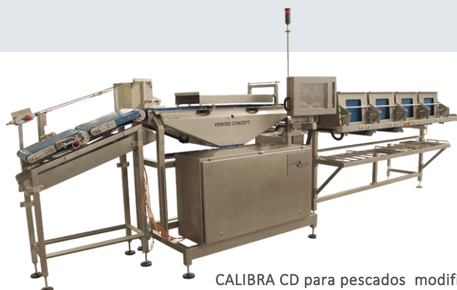
CALIBRA CD para pescados modificada